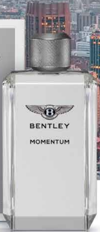
BENTLEY MOMENTUM EAU DE TOILETTE, 100 ml