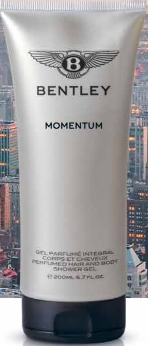
BENTLEY MOMENTUM PERFUMED HAIR AND BODY SHOWER GEL, 200 ml