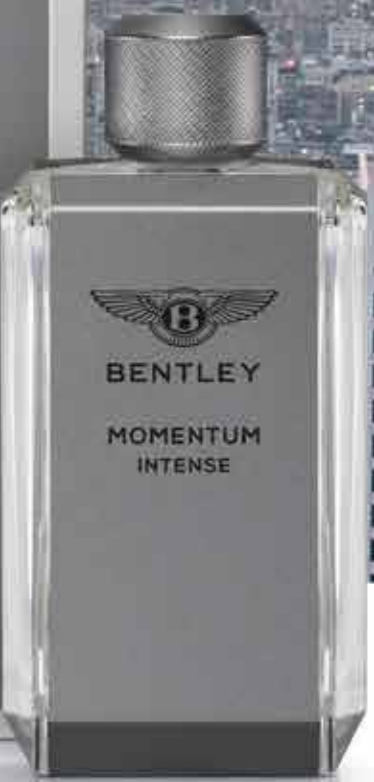
BENTLEY MOMENTUM INTENSE EAU DE PARFUM, 100 ml