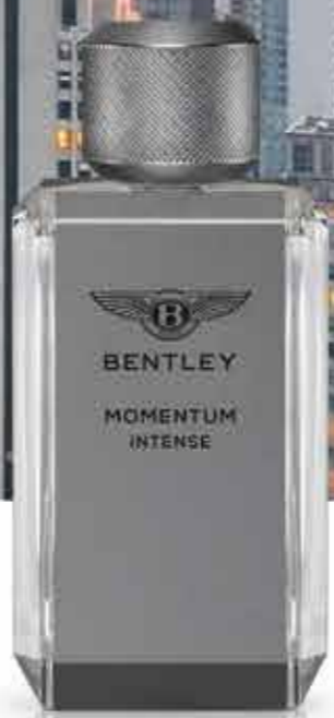
BENTLEY MOMENTUM INTENSE EAU DE PARFUM, 60 ml